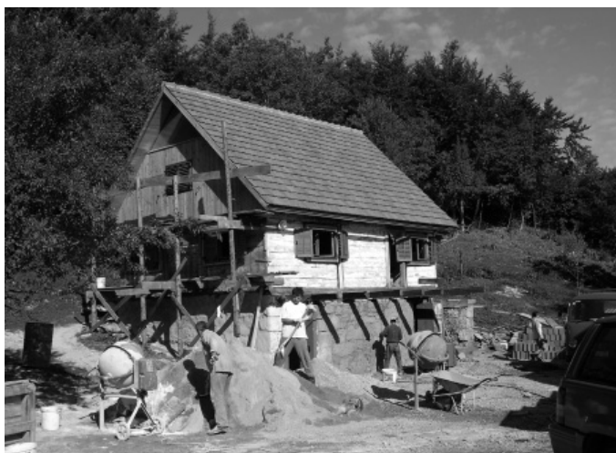
Kuća u obnovi

gdje odlaze prvoklasni trupci bukovine sa Velebita? Na Bliski istok (preko Italije) u odaje njihovih šeika i prinčeva koji luduju za namještajem izrađenim od parene Velebitske bukve, koja je zbog svojeg sporog rasta i čvrstoće jedna od najcjenjenijih u svijetu. Recite mi, zar smo mi tako nevjest narod da sami ne bi umjeli izrađivati taj namještaj i prodavati ga Arapima, već prodajemo sirovinu (trupce) Talijanima u zamjenu za šaćicu eura? U isto vrijeme, Talijani nama pro-