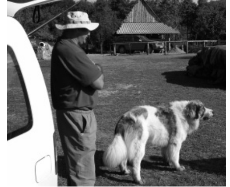
"Valjda me neće..."

Čuvar posjeda je jedna ogromna, još mlada životinja nevjerojatna krzna i snage, hrvatski planinski pas, poznatiji pod nazivom tornjak. Odaziva se na poziv Medo i to samo ukoliko je od volje. I koliko god mami na maženje i igru, nekako nikada nisi siguran da neće... Sva srića