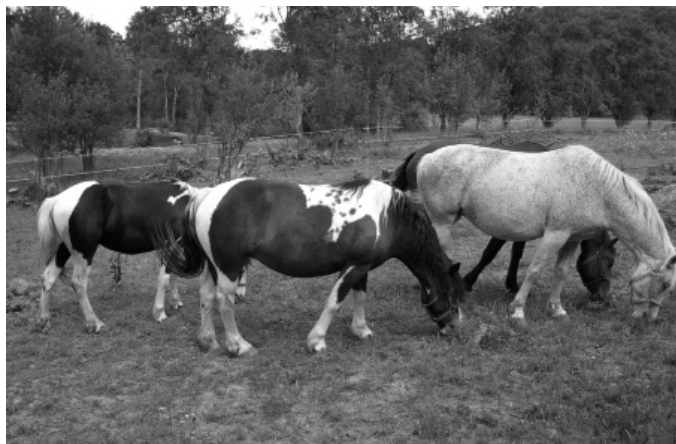
Na ličkim pašnjacima

brinuti da šume bude korištene na održivi način? A oni koji će se baviti izvozom pitke vode, hoće li stvarno brinuti kada u Dalmaciji ponestane vode za piće? Znači, ono što je Venecija započela prije 300 godina, kada je sasjekla južnu stranu Velebita, sada će završiti Europska Unija, kada sasiječe slavonske hrastove šume za svoj masivni namještaj. Je li znate